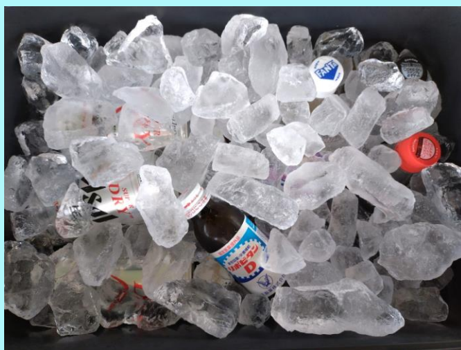
本戦初戦敗退ペアには敢闘賞としてこちらから一本