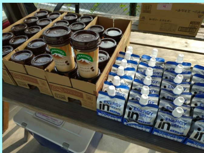
参加賞はマウントレーニアとウィダーインゼリー